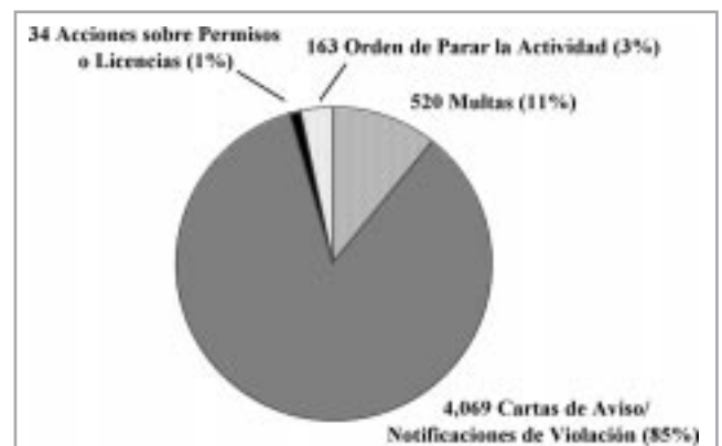
Figura II. Acciones para ejecutar las leyes sobre pesticidas en todo el estado, año fiscal 2000/2001